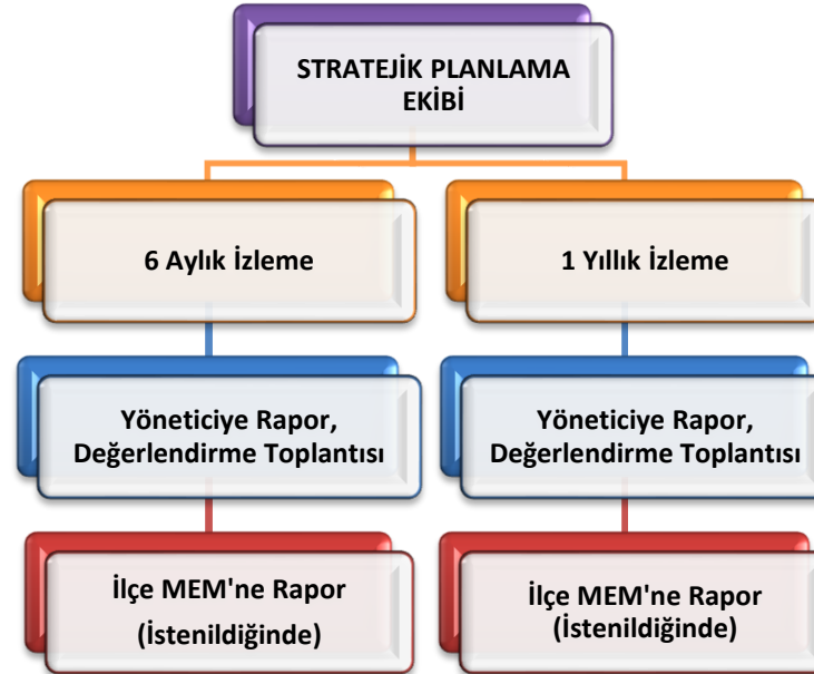
Şekil 8 Stratejik Plan İzleme ve Değerlendirme Modeli

Okulumuz Stratejik Planı izleme ve değerlendirme çalışmalarında 5 yıllık Stratejik Planın izlenmesi ve 1 yıllık gelişim planının izlenmesi olarak ikili bir ayrıma gidilecektir. Stratejik planın izlenmesinde 6 aylık dönemlerde izleme yapılacak denetim birimleri, il millî eğitim müdürlüğü ve Bakanlık denetim ve kontrollerine hazır halde tutulacaktır. Yıllık planın uygulanmasında yürütme ekipleri ve eylem sorumlularıyla aylık ilerleme toplantıları yapılacaktır. Toplantıda bir önceki ayda yapılanlar ve bir sonraki ayda yapılacaklar görüşülüp karara bağlanacaktır. 2024-2028 yıllara göre faaliyet raporları (Haziran-Temmuz) hazırlanarak İl / İlçe Milli Eğitim Müdürlüğü Strateji Geliştirme Hizmetleri Şube Müdürlüğüne gönderilmek üzere hazır tutulacaktır.